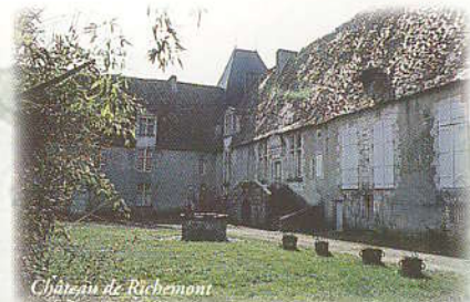
Château de Richenont

Mareuil is located in the "Parc REGIONAL PÉRIGORD-LIMOUSIN" Welcome to Mareuil-sur-Belle, where people know how to eat well and enjoy life.