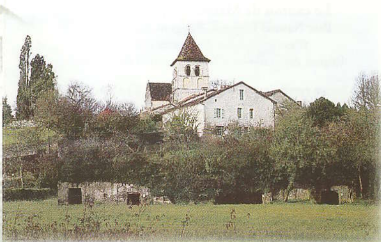
Église et Cluzeaux de Saint-Pardoux