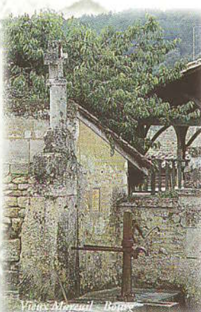
Puits Mareuil - Bata