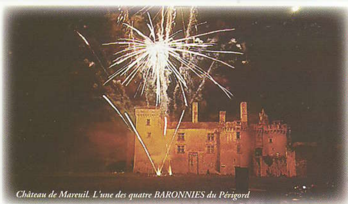
Château de Maveuil. L'une des quatre BARONNIES du Périgord

Plus de 50 associations vous proposent de nombreuses animations tout au long de l'année. Vous trouvez le calendrier des festivités au Syndicat d'Initiative ainsi que des expositions diverses dans le canton.